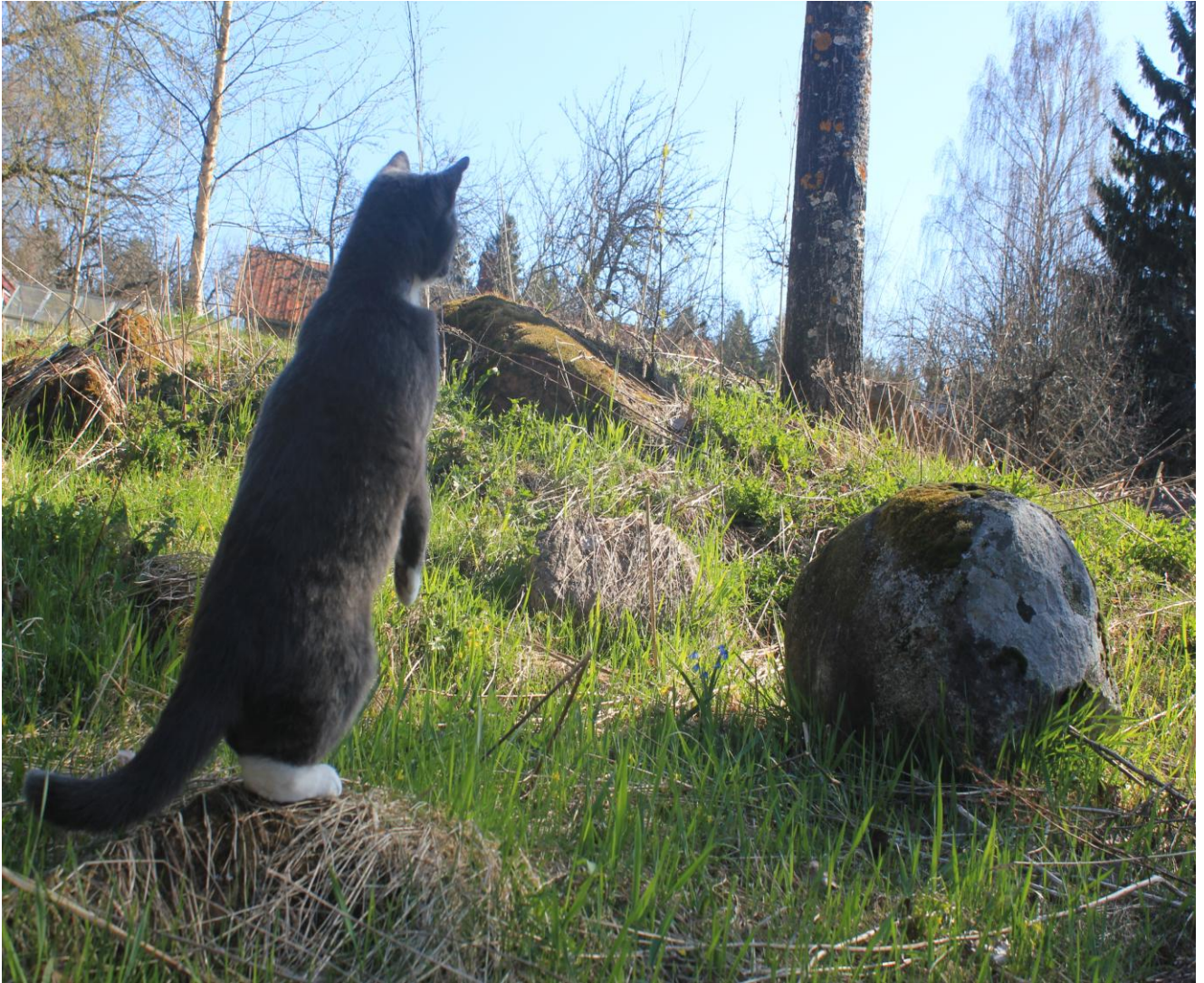
Viivi-kissan kevätloikan

Tämän tiedotteen Sopiva Kylä - ja Kyläportaali -hankkeiden osuutta on rahoittanut Kaakkois-Suomen ELY-keskus. Tiedotteen sisällöstä vastaa Kymenlaakson Kylät ry sekä yhdistyksen Sopiva Kylä - ja Kyläportaali -hankkeet.