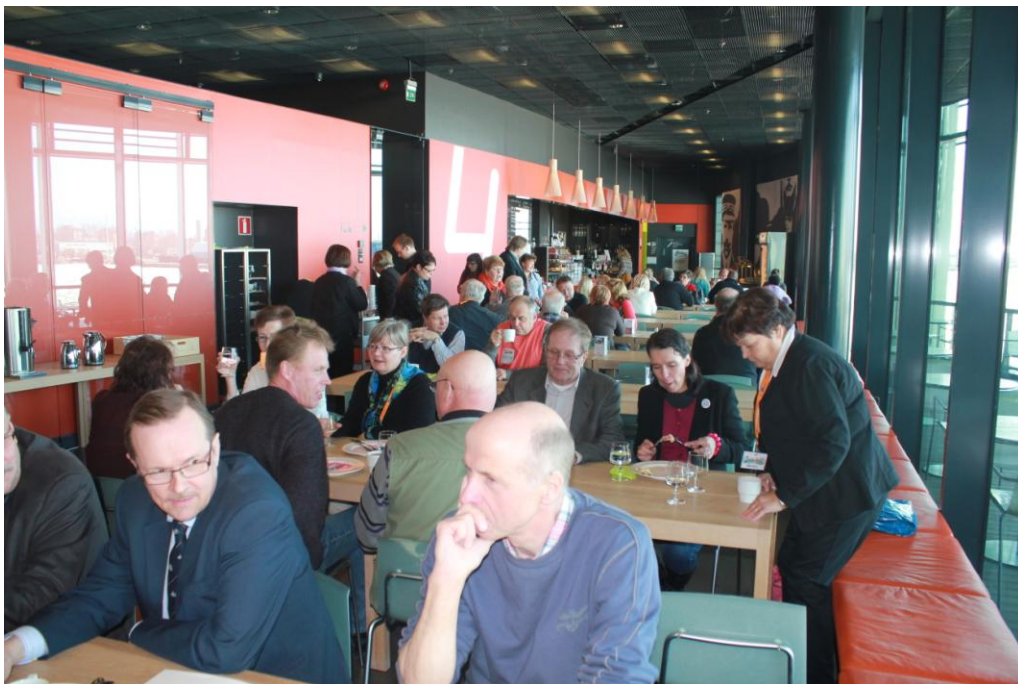
Foorumin tauoilla tavataan tuttuja ja vaihdetaan kuulumisia. Kuva Vellamosta keväällä 2011