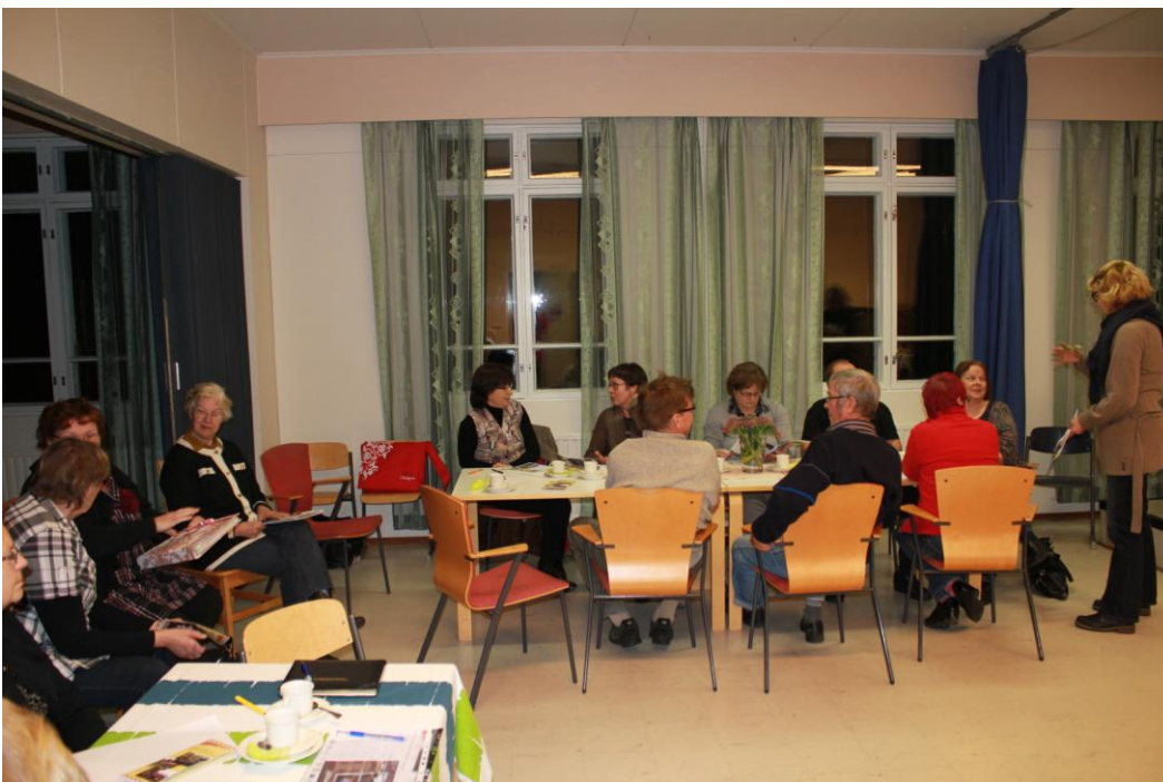
Hankkeiden yhdessä järjestämä kyläilta Teuroisten kylätalolla lokakuussa 2011.