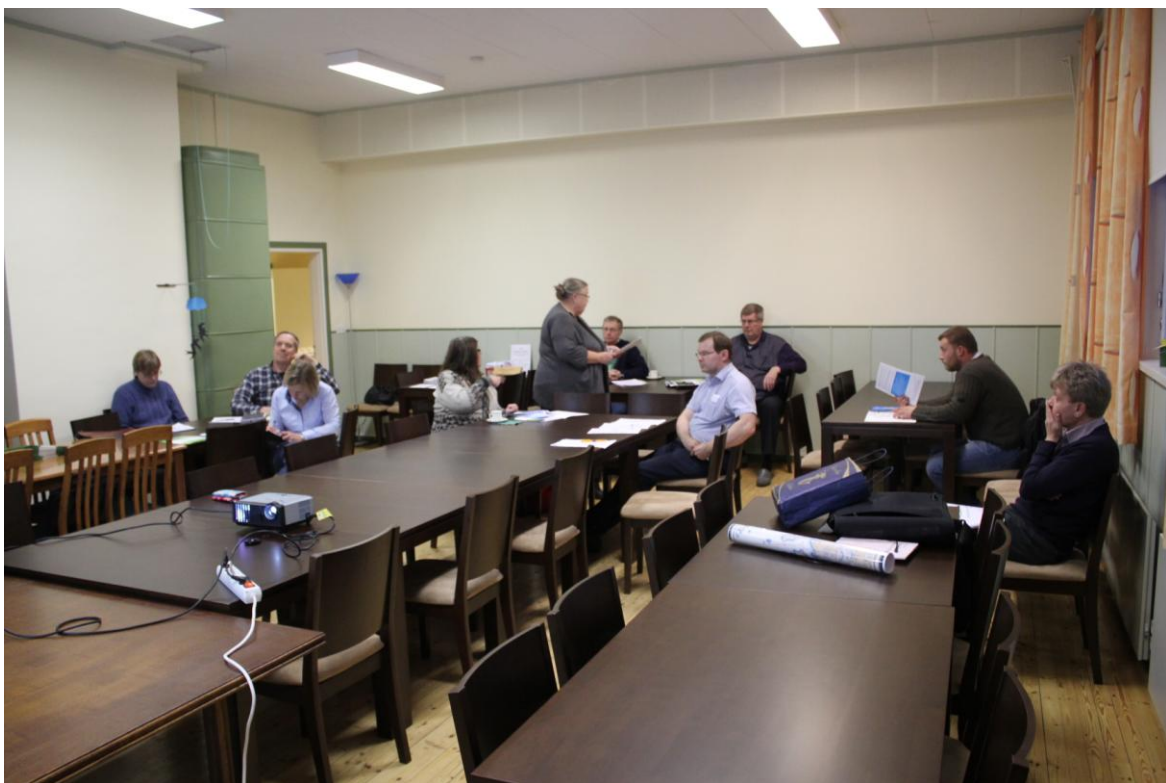
Kymenlaakson Kylät ry:n sääntömääräinen syyskokous Siikavan Kylätalolla

Hallitus kokoontuu järjestäytymiskokoukseensa 12.1.2012, jolloin valitaan varapuheenjohtaja, tehdään sihteeritehtävistä ja taloudenhoidosta järjestelyitä tulevalle vuodelle ja valitaan edustajia yhteistyötahojen kokouksiin.