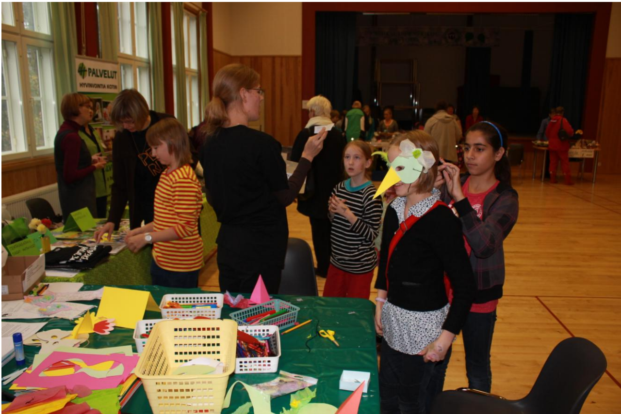
Kylä- ja asukastapahtumassa Husulan Vehkalinnassa 22.10. Kaakonkulman 4H järjesti monenlaista tekemistä osallistujille