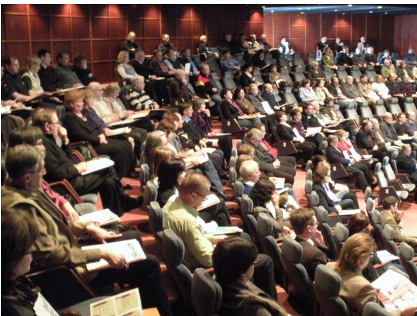
Kuva; Maaseutufoorumista 2010 Muutosenergiaa, Kuusankoski-talo