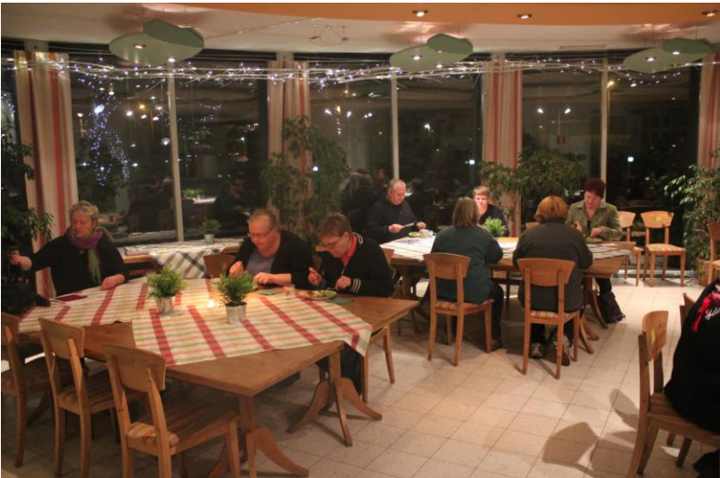
Varsin pikkujouluisissa tunnelmissa tavattiin Kymen Paviljongilla marraskuun illassa.

Illan annista tehtävän yhteenvedon laatiminen on vielä kesken, mutta edellisvuoden kokemusten perusteella voidaan nytkin olettaa useita konkreettisia aloitteita ja ehdotuksia, joita lähdetään viemään eteenpäin.