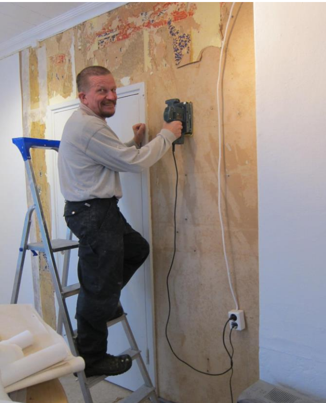
Kyläavustaja työn touhussa Kyläkonttorilla!

Kyläyhdistyksen jäsenet voivat ostaa yhdistykseltä kyläavustajapalveluita, joita voivat olla jokamiestason, ei-ammattitaitoa vaativat työt, kuten puunpinoaminen, pihatyöt, asiointi, neuvonta tai atk-tuki. Edellä mainitut työtehtävät ovat vain esimerkkejä, sillä jokaisen kylän tarve ja työllistettävän osaaminen muovaavat työtehtävät omanlaisikseen.