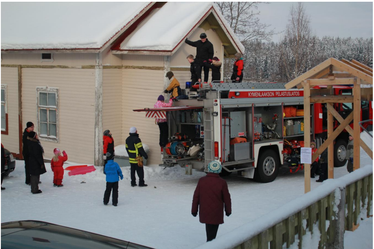
Paikalliset VPK:t ovat tuttu näky monissa kylätapahtumissa. Kuva Enäjärveltä helmikuulta 2012, kun Kaipaisten VPK esitteli kalustoa ja opasti tapahtumaan osallistuneita.

Paljon on siis tulossa ja tapahtumassa. Seuraa ilmoittelua. Miettikääpä jo nyt kesän aikana siellä kylillä, mitkä toimenpiteet teitä kiinnostaisivat. Lähdetään elokuusta lähtien yhdessä parantamaan kymenlaaksolaista arjen turvallisuutta!