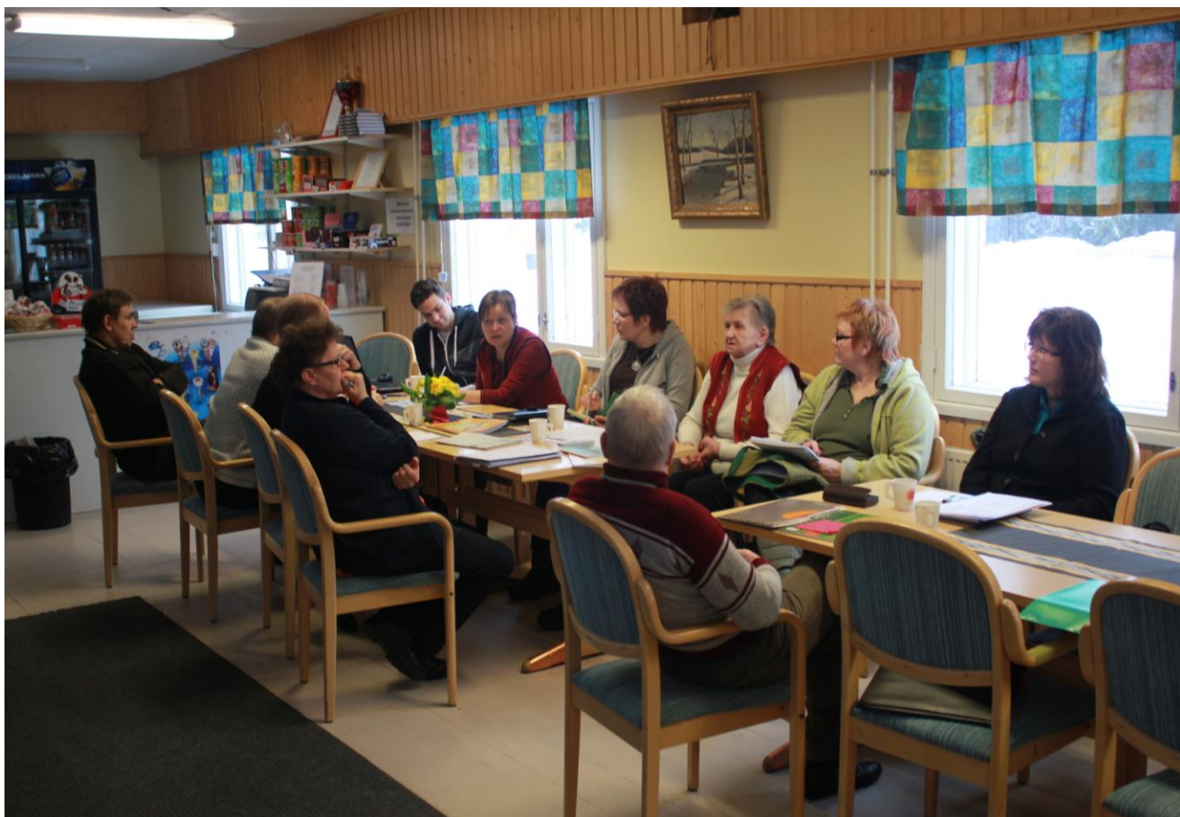
Suur-Miehikkälän seurantalo toimii tapahtumanäyttämönä. Kuva keväältä 2012, kun puuhattiin Miehikkälän osuutta kyläkirjaseen.

Tapahtuma huipentuu illalla Purhon lavalla pidettäviin markkinatansseihin.