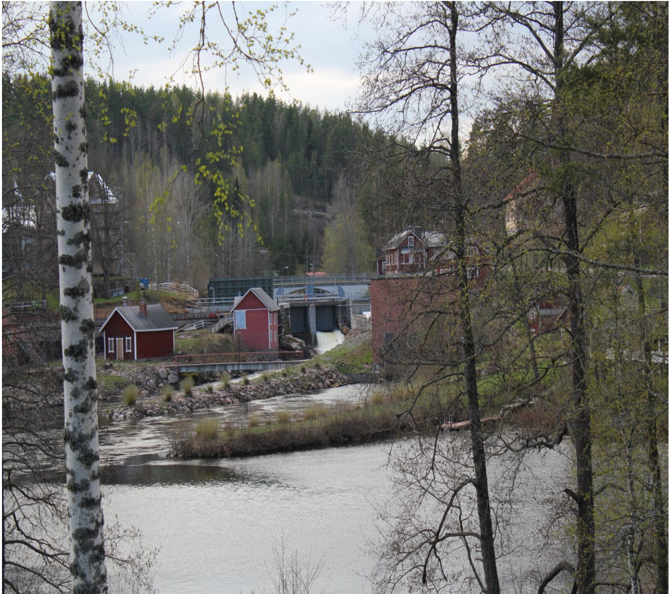
Vuoden 2013 kymenlaaksolainen kylä Verlanseutu

Tämän tiedotteen Sopiva Kylä -, Kyläportaali -, ja Arjen Turva -hankkeiden osuutta on rahoittanut Kaakkois-Suomen ELY-keskus. Tiedotteen sisällöstä vastaa Kymenlaakson Kylät ry sekä yhdistyksen Sopiva Kylä -, Kyläportaali -, ja Arjen Turva -hankkeet.