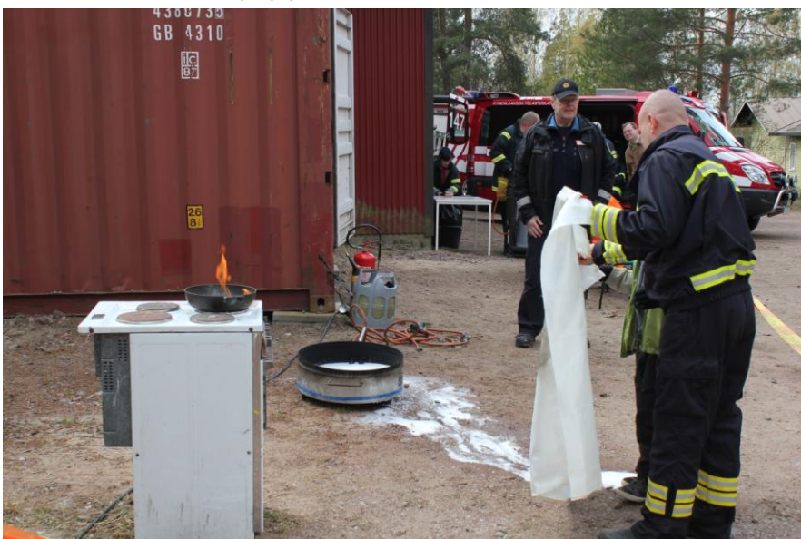
Hurukselan tapahtumassa saatiin opastusta sekä sammuttimen että sammutuspeitteen käytöstä

Kiinnostaisiko teitä alkusammutusopastus tai pienimuotoinen etsintäharjoitus tms. Näitäkin pyrimme järjestämään, jos vain kiinnostusta löytyy.