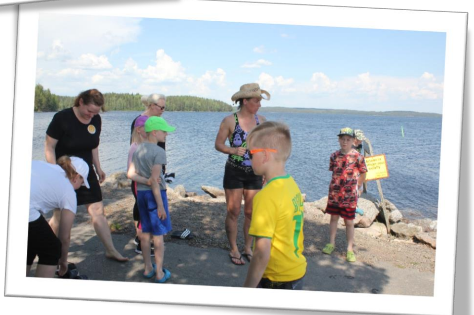
Jokuen tehtävapistellä sup-lautailtiin.