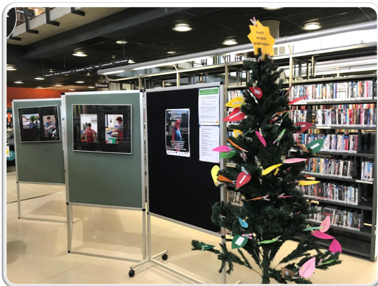
Vapaaehtoistoiminnan puu.