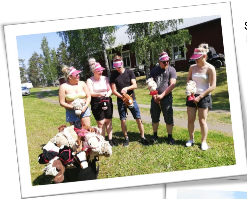
Säyhteen tehtävapistellä keppihevosteltiin.

Kymenlaakson Kylät ry kuulee mielellään, mikäli joku tahon Kymenlaakson alueella alkaa järjestää Kylärallia käsikirjan pohjalta.